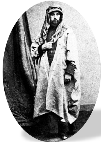
Lavigerie in Syrië

zelf geen goede ondergrond had? Zij moesten dus leren zich aan te passen alvorens naar Noord en Centraal Afrika uitgezonden te worden om de boodschap van Christus te verkondigen. Zijn jonge Sociëteit moest bestaan uit mensen met een onwrikbaar geloof en overtuiging om elkaar bij te staan in het werk, en zo een voorbeeld zijn voor de mensen onder wie zij zouden werken. De eersten die werden uitgezonden wisten dat de meesten van hen nooit hun vaderland en familie terug zouden zien. Tropische ziekten, ontberingen zowel als grote afstanden zouden dat in de weg staan. Jonge mensen kunnen zich avonturiers voelen en zo “opgeslokt” worden door al die nieuwe ervaringen, dat ze hun eigenlijke doel voorbijgaan. Het is daarom dat de Stichter strikte regels gaf om hen te helpen zich te blijven focussen