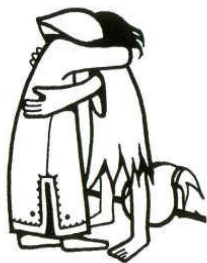
Enthoe Thema visueel contact / Contact and contact with

Op dit moment mag ik met SVD meedenken over waar het allemaal heen zal gaan. De buitenlandse missionarissen zelf denken ook mee en zijn zoekende, vooral om concreet handen en voeten te geven aan een nieuwe moderne missie-inzet hier. Niet gemakkelijk om zo te zoeken naar werk, na een zinvolle invulling van je missionaire opdracht elders. In het kader van een parochiepastoraal is er altijd wel een zekere structuur die enig houvast biedt, maar hoe geef je vaste structuren aan een multiculturele en een multireligieuze ontmoeting en dialoog, aan gewoon naast mensen te staan, mee te lopen, mee te denken, of je gewoon