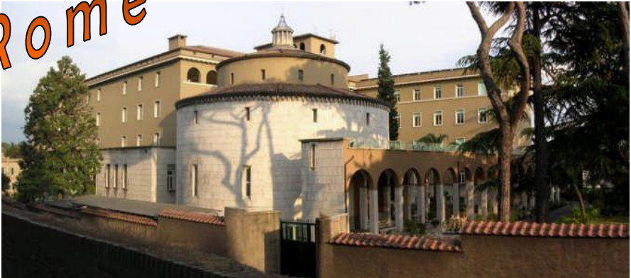
Het generalaat van de Missionarissen van Afrika