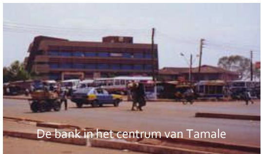
De bank in het centrum van Tamale

In 1995 werd ik directeur van een pastoraal vormingshuis in Tamale en heb dat graag gedaan tot ik in 2009 mijn gouden